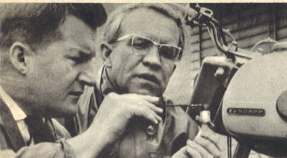
MIT DEM SPION wurde die genaue Elektroden-Einstellung der Zündkerzen überprüft. Denn nur exakte Verbrennung bringt gute Leistung.